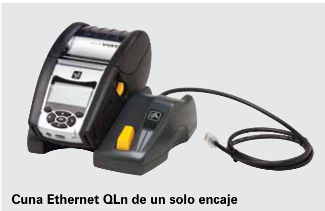
Cuna Ethernet QLn de un solo encaje