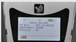
Pantalla de lectura fácil, más grande y con mayor resolución