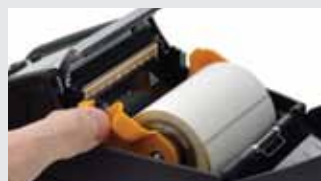
Uso intuitivo del dispensador