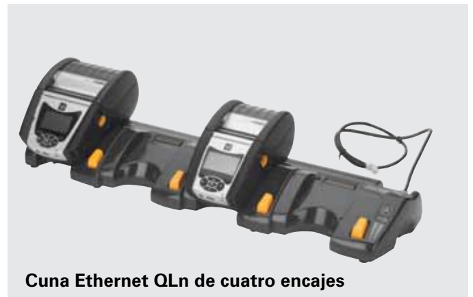
Cuna Ethernet QLn de cuatro encajes